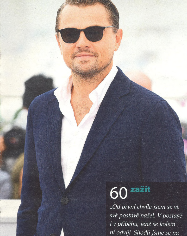
LEONARDO DICAPRIO herec