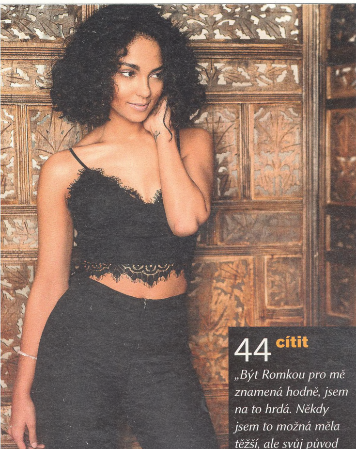
ZEA tanečnice a zpěvačka

„Než došlo k tomu, že se začaly průmyslově vyrábět potraviny, byly hlavní příčinou úmrtí v populaci infekce. V současné době jsou to civilizační nemoci.“