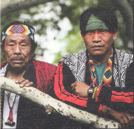
HUNI KUIN indiánský kmen