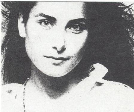
ZORA JANDOVÁ herečka