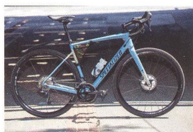
72 MĚSÍC V MĚSTSKÉM PROVOZU Silniční a přesto odpuzený Specialized Diverge Carbon Comp