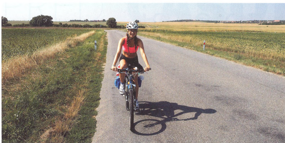
16 a 20 ZAHRAŇIČNĚ-DOMÁCÍ CYKLOTRASA Rakouské a německé příhraničí s juniory