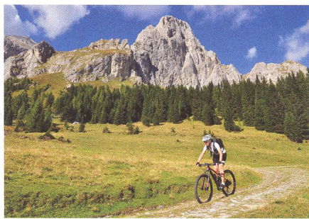
24 ZAHRAŇIČNÍ REGION Italská Piava, svatá řeka vlasti