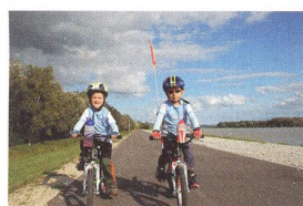
56 VOZÍ SE I JSOU VEZENI Kariéra mladého cyklisty od A do Z Zkušenosti rodičů s motivací