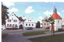
38 DOMÁCÍ CYKLOTRASA Kolečko kolem Plzně