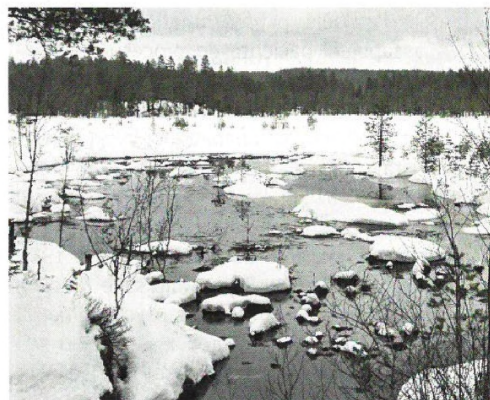
Život a přírodní léčba v tajze 26

Díváme-li se kolem sebe, vidíme barvy, tvary, slyšíme zvuky a cítíme vůně. Příroda není němá a mluví s námi výraznými elementárními prostředky. Souvisí s tím působení základních živlů, které si v člancích tématu podrobně rozebereme. Zamysleme se nad tím, jak na nás působí živly z našeho okolí a také se dotkneme důležitosti určení vlastní živlové podstaty.