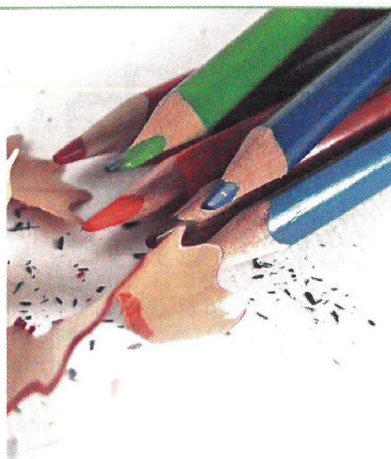
Poprvé do školy 9