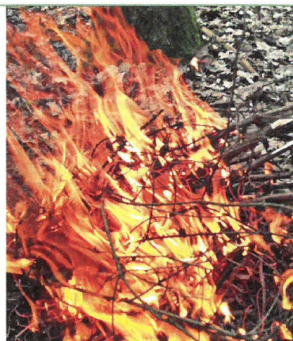
Živly kolem nás i v nás 10