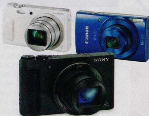
20 kompaktních fotoaparátů s velkým optickým přiblížením (str. 16–21)