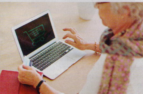
Nákupy přes internet: Jak ušetřit a jak postupovat při reklamacích