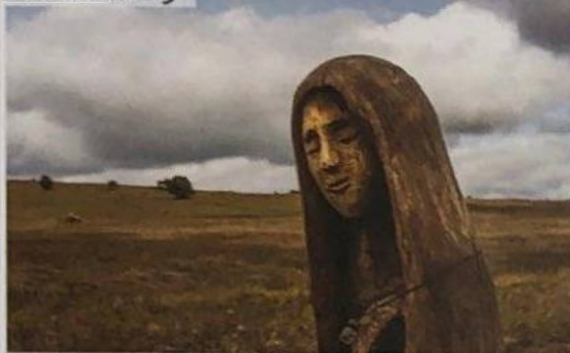
Údolí zázraků paměti a tvůrčí fantazie