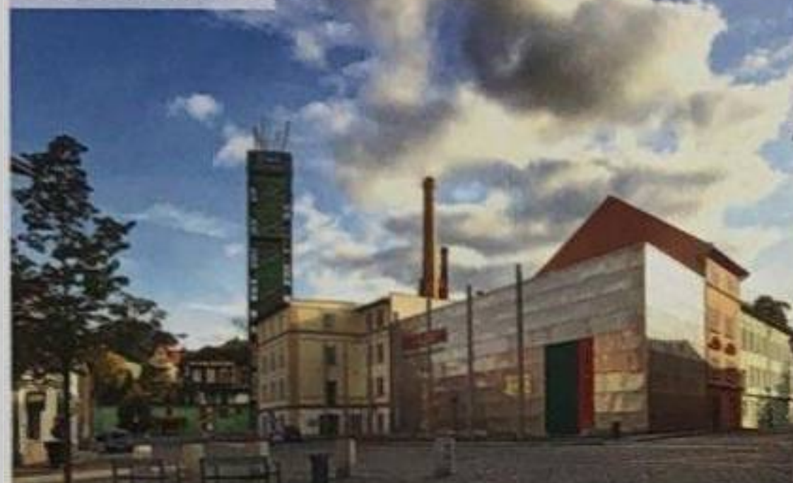
Žatecké chmelové památky a UNESCO