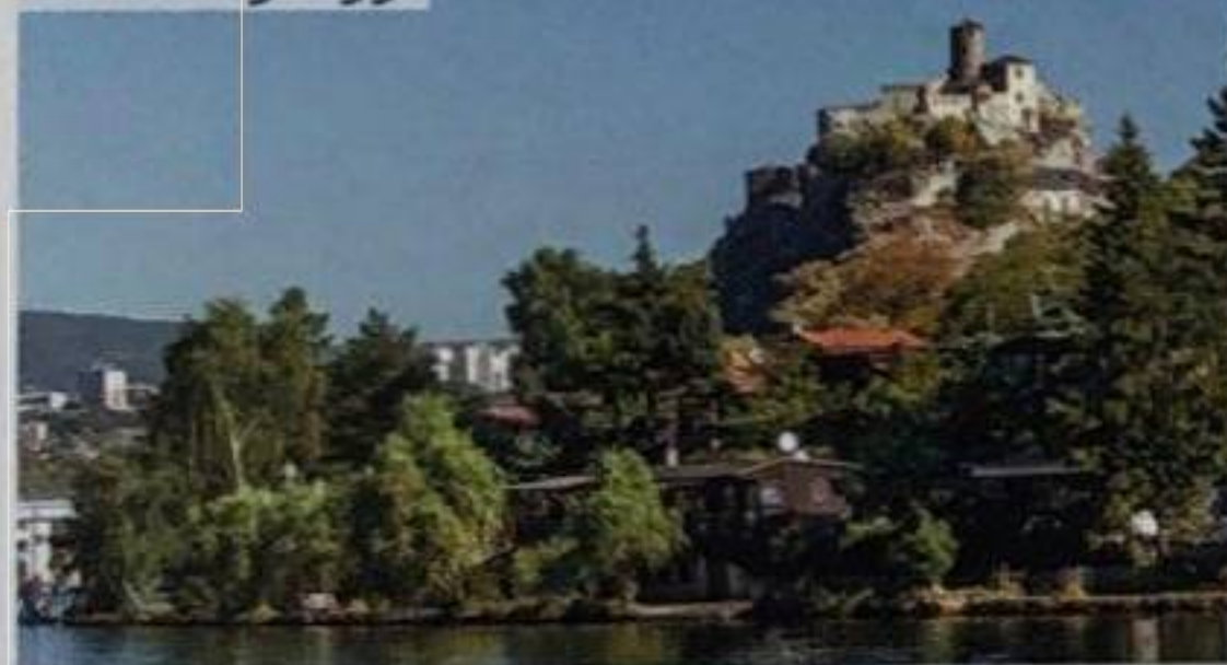
Odvážný vandr po hradech Českého středohoří