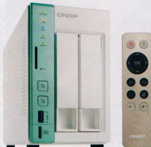
Jak ochránit cenná data (str. 15–19)