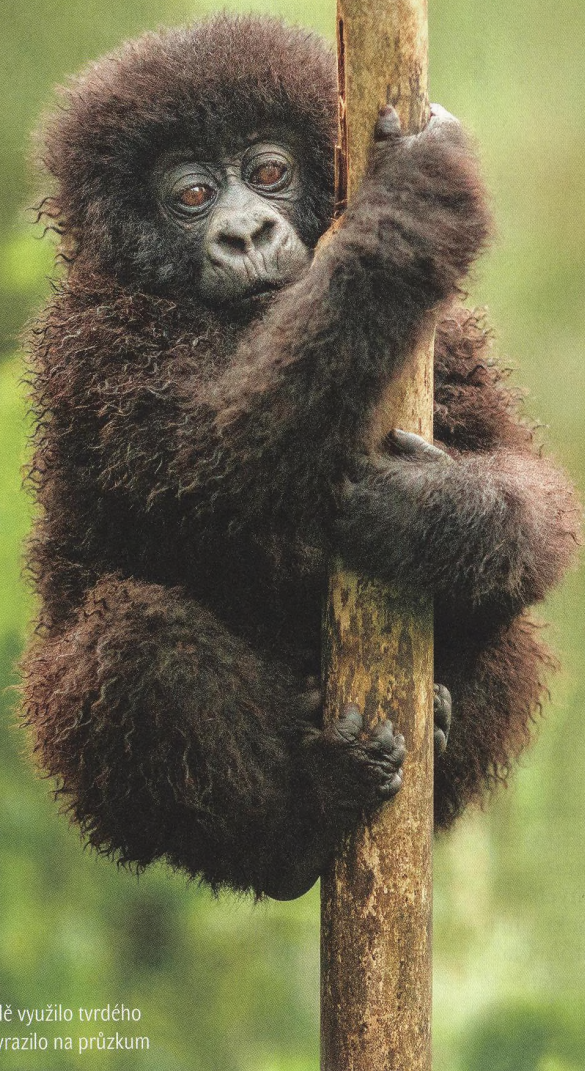
➤ Malické gorilí mládě využilo tvrdého spánku své matky a vyrazilo na průzkum

59 TVOŘIVÉ SÍLY ŘEKY IAPÓ Kaňon Guartelá v brazilském spolkovém státě Paraná je považován za šestý největší na světě