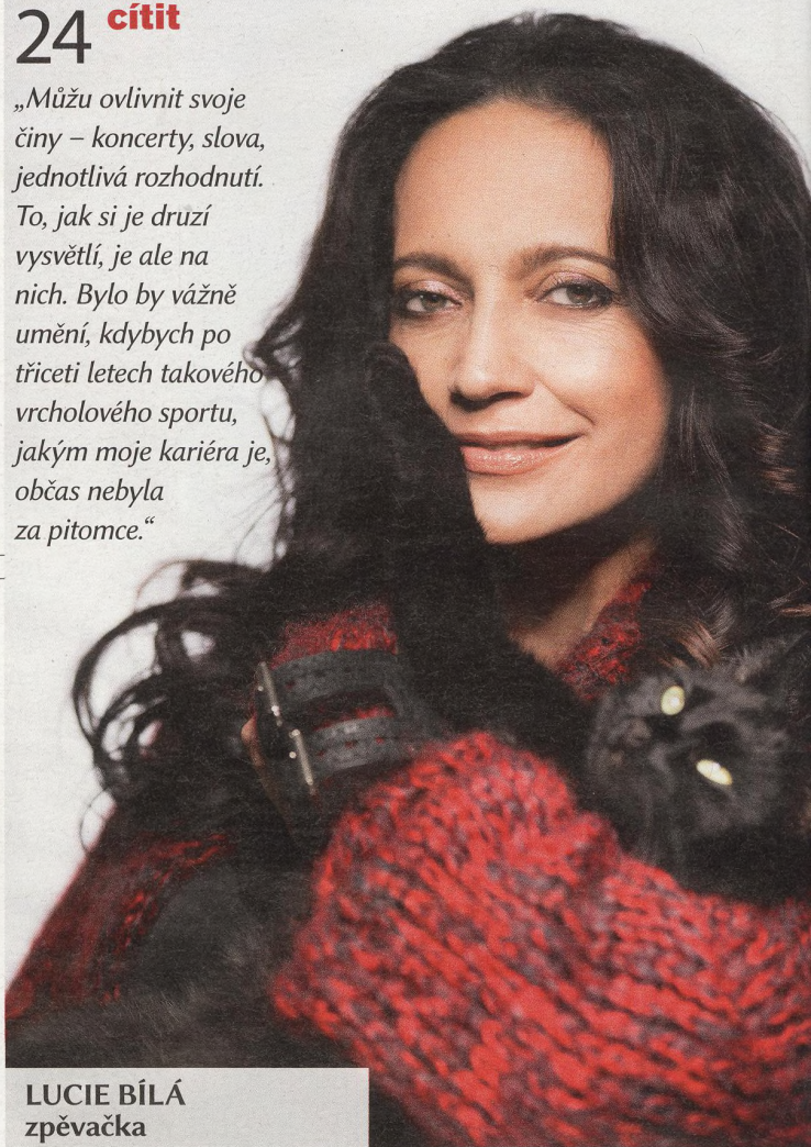
LUCIE BÍLÁ zpěvačka

„Můžu ovlivnit svoje činy – koncerty, slova, jednotlivá rozhodnutí. To, jak si je druzí vysvětlí, je ale na nich. Bylo by vážně umění, kdybych po třiceti letech takového vrcholového sportu, jakým moje kariéra je, občas nebyla za pitomce.“