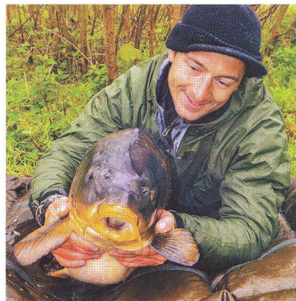
10 Běh přes překážky