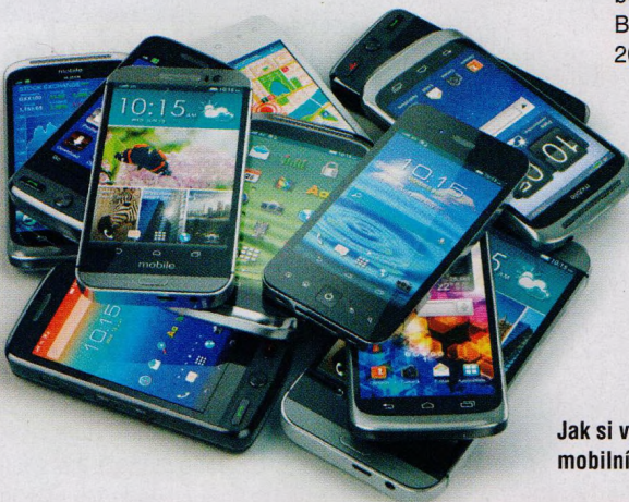
Jak si vybrat ideální mobilní telefon (str. 12–17)