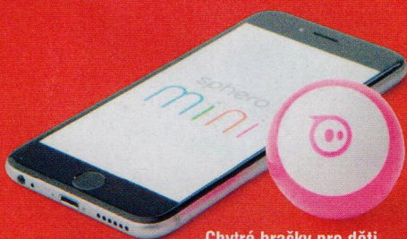
Chytré hračky pro děti i pro dospělé (str. 26–29)