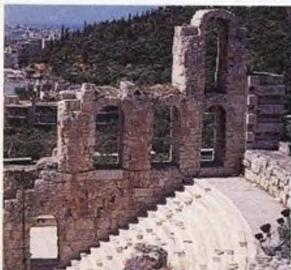
Divadlo Héróda Attika