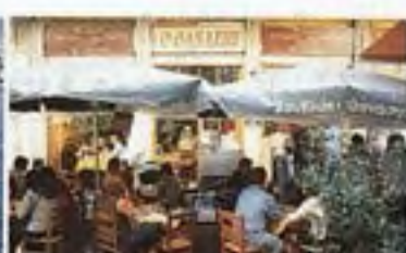
Restaurace nabízející suvlaki, Monastiraki