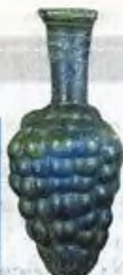
Skleněná láhev, Muzeum A. Benákise