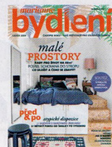
FOTO TIA BORGSMTID/HOUSE OF PICTURES STYLIST: METTE HELENA RASMUSSEN- RETRO VILLA/ HOUSE OF PICTURES, SHUTTERSTOCK.COM