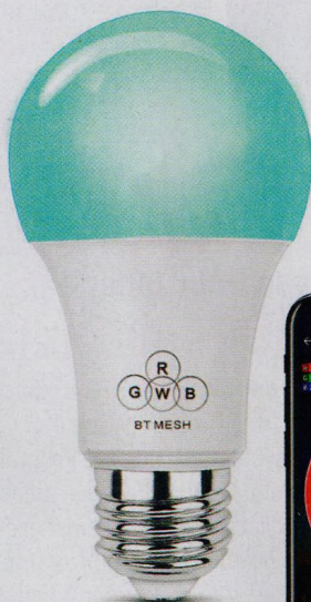
Ovládání chytré domácnosti (str. 16–19)