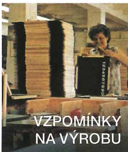
VZPOMÍNKY NA VÝROBU