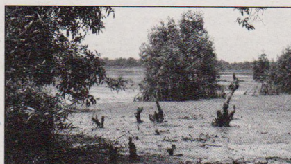
18| Ropná skvrna jménem Delta Nigeru