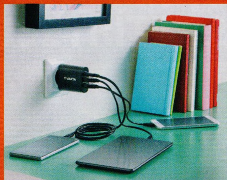
Užitečné doplňky a příslušenství k tabletům (str. 26–27)