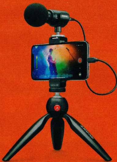
Rady pro natáčení videa mobilem a tipy na užitečnou výbavu (str. 28–32)