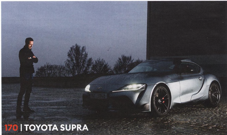
170 | TOYOTA SUPRA

Co takhle do nového roku dekadentní snídani a pokračovat potom rovnou večerí? Recenze bistra Bockem.