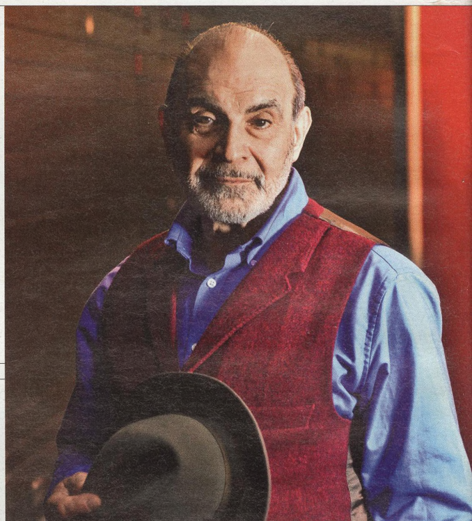
DAVID SUCHET herec

„Domažlice pro mě zůstávají stále symbolem každoročního znovuzrození dudáckého kumštu, národních písní a tanců, které mají společný dorozumivací jazyk: jazyk srdce a citu.“