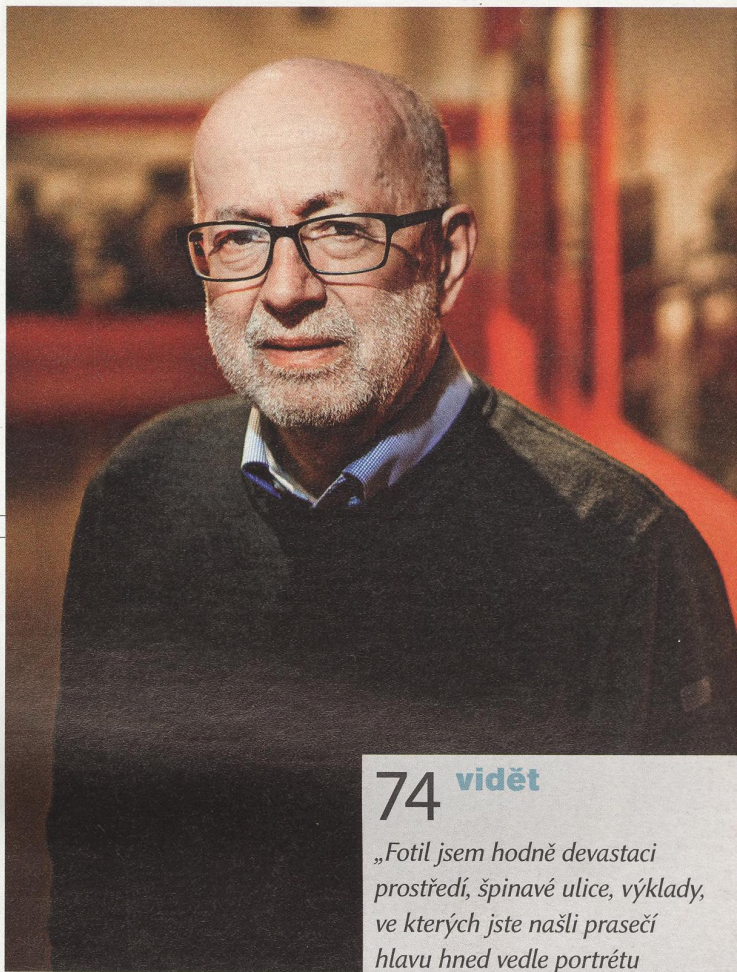
VLADIMÍR BIRGUS fotograf