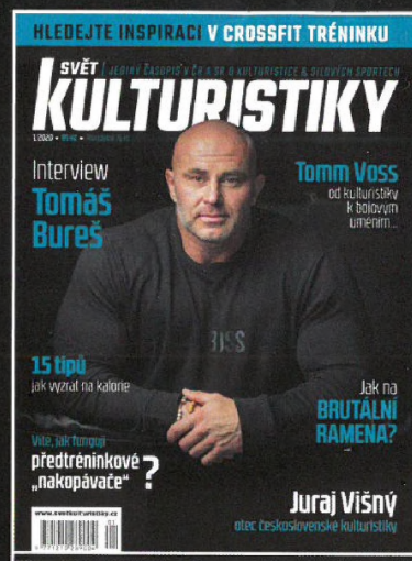
FOTO: JOSEF ADLT – bateriová záblesková světla Phototools.cz, foto v Olympia fitness Hostivář