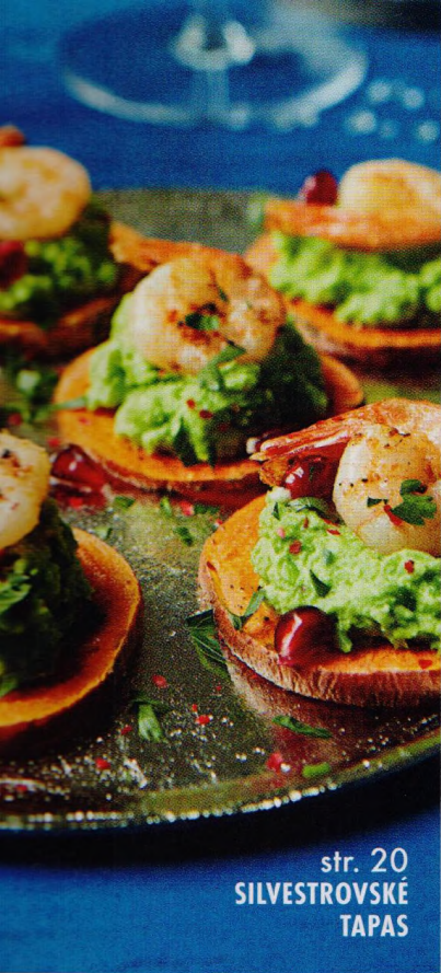
str. 20 SILVESTROVSKÉ TAPAS