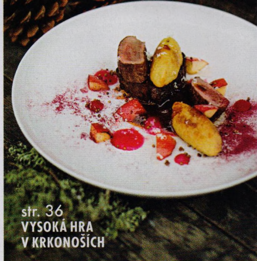
str. 36 VYSOKÁ HRA V KRKONOŠÍCH