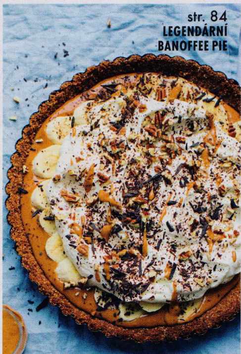
str. 84 LEGENDÁRNÍ BANOFFEE PIE