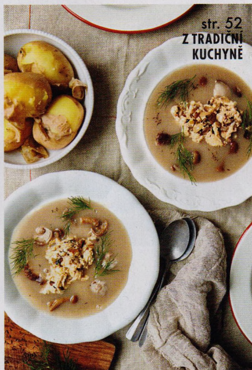
str. 52 Z TRADIČNÍ KUCHYNĚ