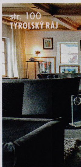
str. 100 TYROLSKÝ RÁJ