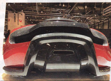
Engler Superquad F.F