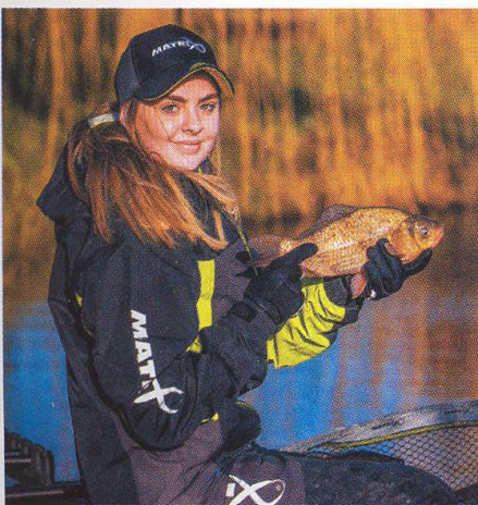
30 Jednoduchá cesta k úspěchu...