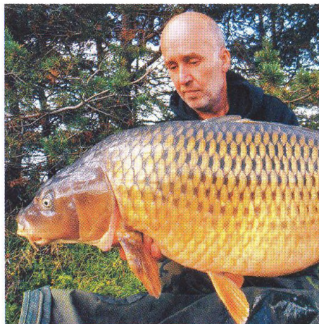
16 Rok jako z pohádky