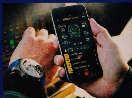
Nositelná elektronika: chytré náramky, hodinky a spol. (str. 28–31)