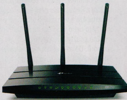
Budujeme domácí síť (str. 12–18)