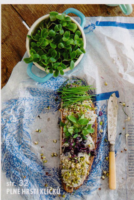
str. 32 PLNÉ HRSTI KLÍČKŮ