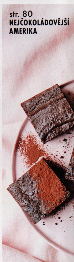
str. 80 NEJČOKOLÁDOVĚJŠÍ AMERIKA