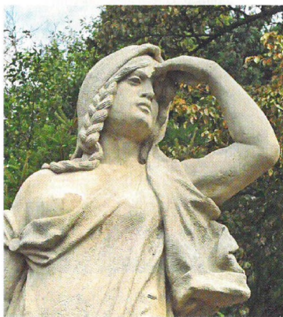
Cesta k sobě ..... 26

Kůže je největší orgán našeho těla a během teplé poloviny roku je velmi namáhána, protože jsme méně chráněni oděvem. Čínská medicína kůži řadí do energetického okruhu kovu. Řekneme si, jak nahlíží na nejčastější kožní problémy a neduhy. Kromě toho se v našich příspěvcích dozvíte i o tom, jak o pleť pečovat přírodními prostředky, a jak ji nejlépe chránit před letním sluníčkem, neboť krémy s ochrannými faktory nám mohou škodit kvůli obsahu neurotoxického hliníku.