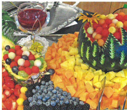
Pomoterapie – léčba ovocem ..... 34

Geny představují významné téma, a to přinejmenším ze dvou důvodů. O tom prvním již Meduňka základní informace přinesla – informovala o vzniku nových oborů, jejichž cílem je podpořit cestu za zdravím pomocí přírodní, přirozené stravy. Autoři se v tomto článku věnují druhému důvodu – upozorňují na některé nejasnosti a mýty, které toto téma obklopují a uvádějí je na pravou míru. Připomínají také, že geny samy nemoc nevyvolávají, ale působí jen tehdy, když jsou podněceny.