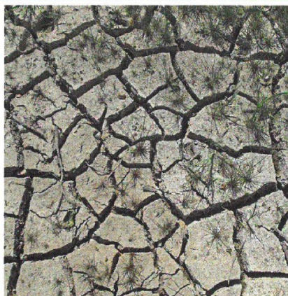
Pro zdravou a krásnou kůži ..... 10