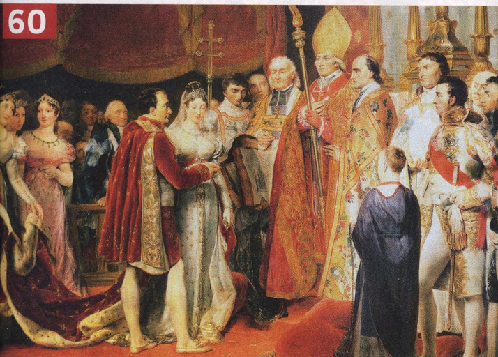
« Svatba Napoleona s rakouskou arcivévodkyní Marií Louisou, detail obrazu Georsege Rougeta z roku 1810