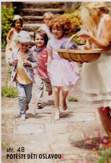
str. 48 POTĚŠTE DĚTI OSLAVOU