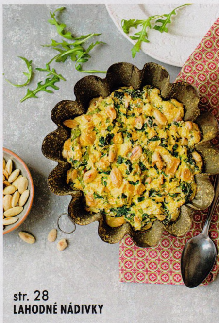
str. 28 LAHODNÉ NÁDIVKY