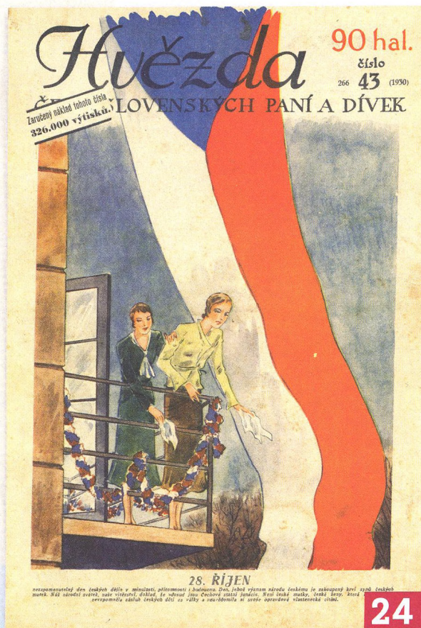
↗ Československá vlajka na titulní straně listu „Hvězda“ z roku jejího 10. výročí existence (1930)