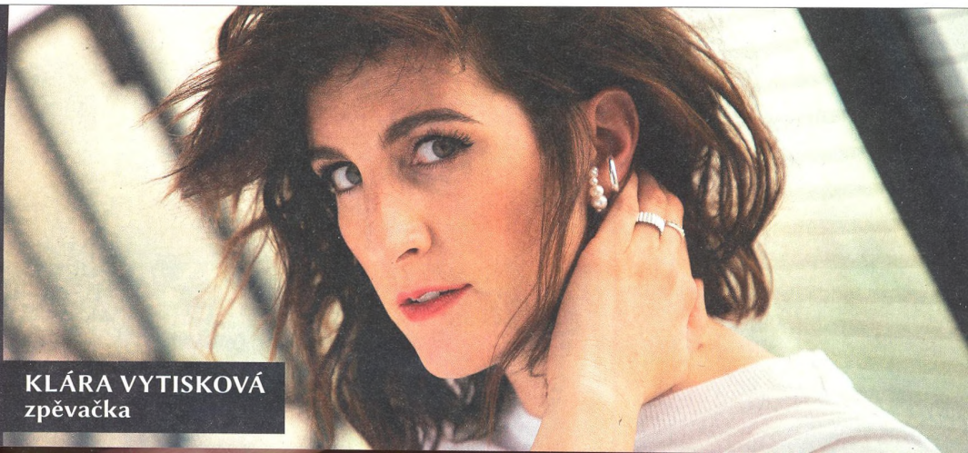
KLÁRA VYTISKOVÁ zpěvačka

„Lidé mají vzhledem k sociálním sítím potřebu se s někým porovnávat. Každý z nás má ale přitom svou cestu, někdo rychlejší, jiný pomalejší. Je v pořádku, když jeden běží a druhý jen jde.“