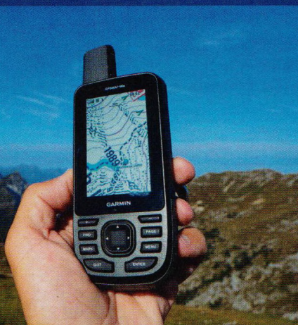
Mapy, navigace a průvodci pro turisty (str. 24–30)