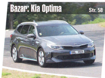
Bazar: Kia Optima