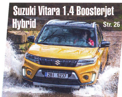
Suzuki Vitara 1.4 Boosterjet Hybrid