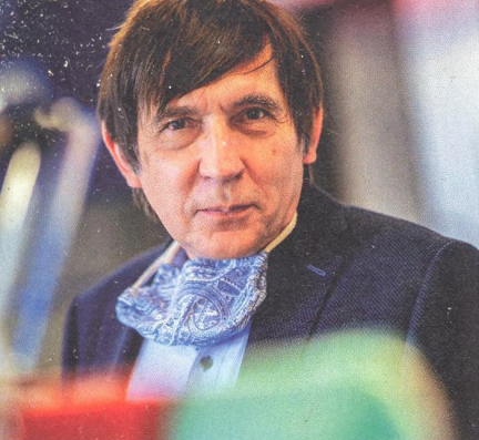
PETR DRÁBER ředitel Ústavu molekulární genetiky Akademie věd ČR