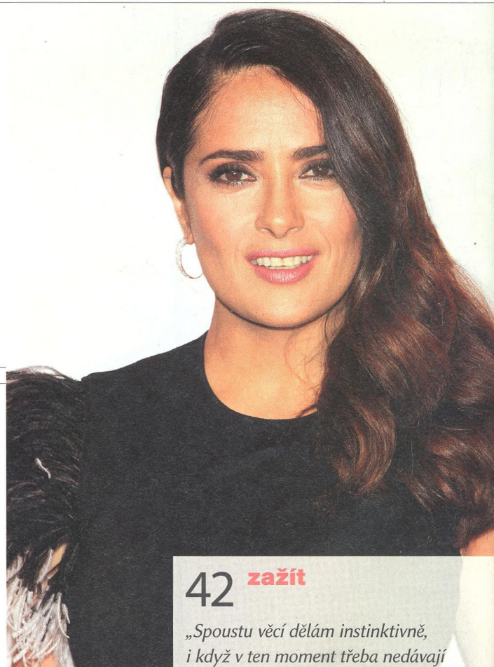
SALMA HAYEK herečka

„Lidé mají varhany spjaté s kostelem a duchovní liturgickou hudbou. Chci jim ukázat, že je to jinak.“