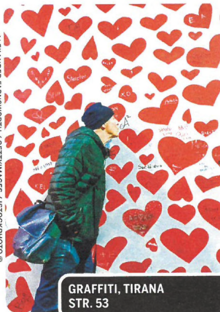
GRAFFITI, TIRANA STR. 53