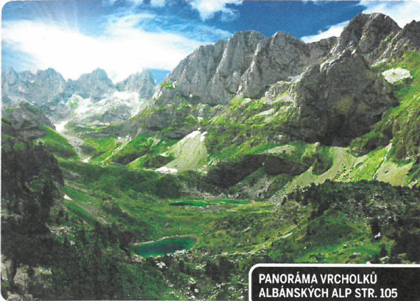
PANORÁMA VRCHOLKŮ ALBÁNSKÝCH ALP STR. 105