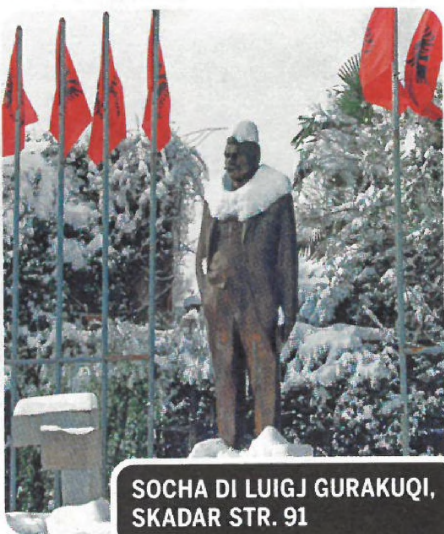
SOCHA DI LUIGJ GURAKUQI, SKADAR STR. 91