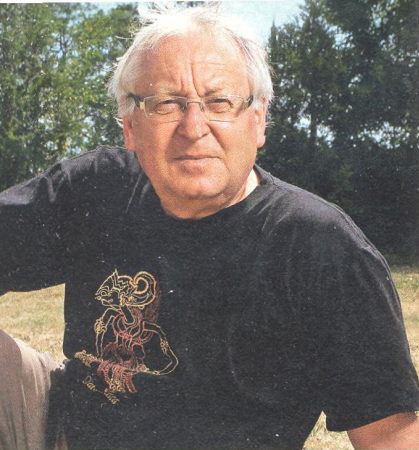
VÁCLAV CÍLEK geolog a klimatolog