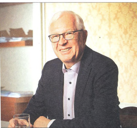
JIŘÍ DRAHOŠ vědec a senátor

„Bydlel jsem v Hell's Kitchen, což je část Manhattanu, a byl obeznámen s pasáky žijícími v okolí. Měl jsem tedy dobrou průpravu.“