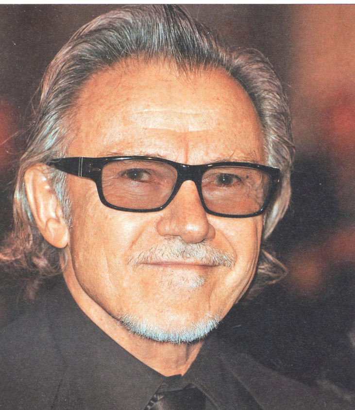
HARVEY KEITEL herec a producent

„Současný svět dobře funguje ve scénáři normálního dne, pak ale stačí jeden vir a kolabuje. Zranitelnost se zvyšuje.“