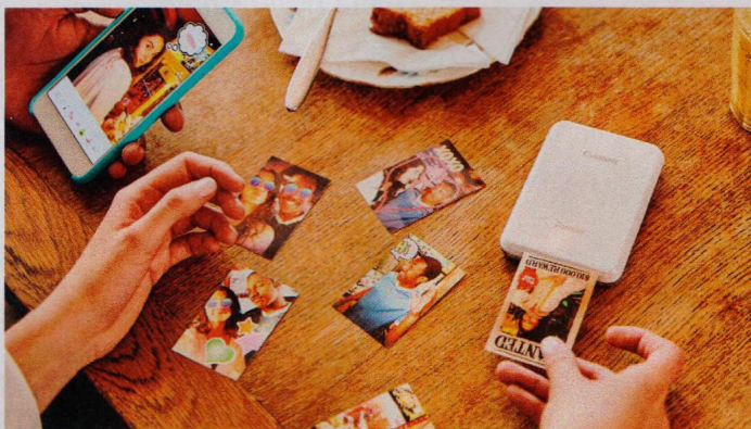
Malé mobilní fototiskárny (str. 18–19)