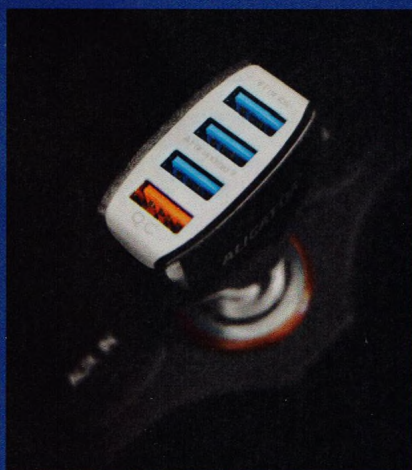
Užitečné příslušenství k mobilnímu telefonu a aplikace na cesty (str. 25–33)