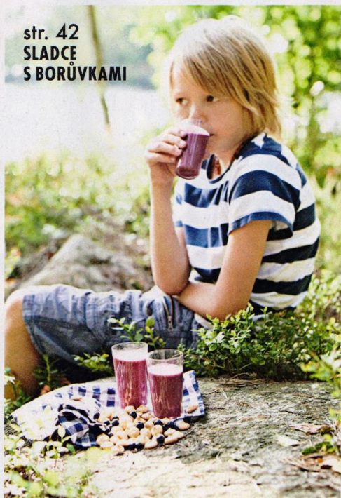
str. 42 SLADCE S BORŮVKAMI