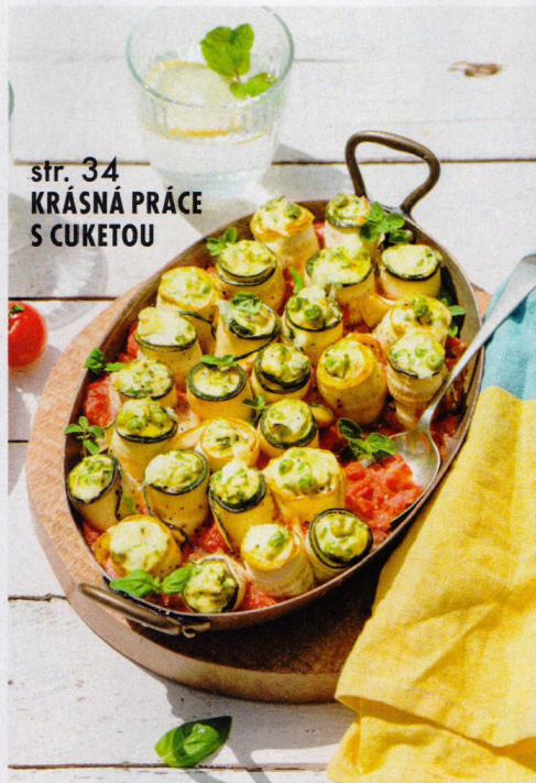
str. 34 KRÁSNÁ PRÁCE S CUKETOU