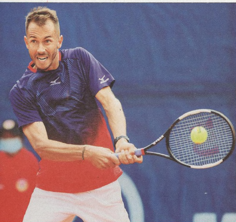
LUKÁŠ ROSOL tenista