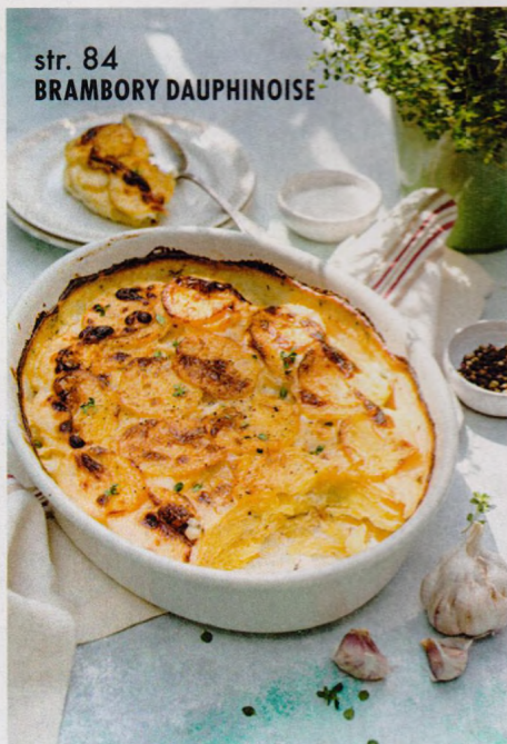
str. 84 BRAMBORY DAUPHINOISE