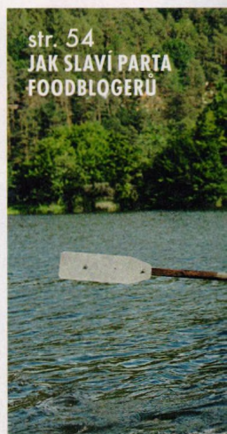
str. 54 JAK SLAVÍ PARTA FOODBLOGERŮ