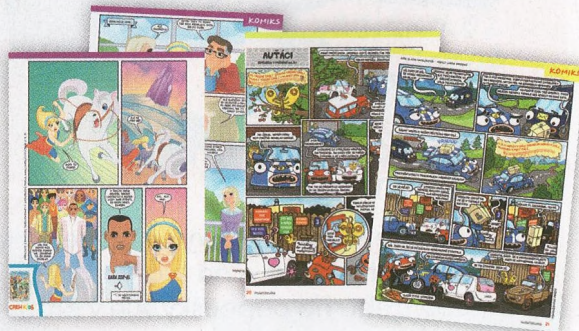
KOMIKSY: Superhrdinky • Autáči