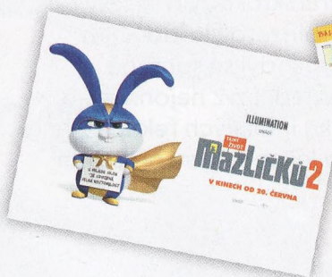
PLAKÁT: Tajný život mazlíčků 2

e-mail: materidouska@cncenter.cz Facebook: @casopisMateridouska