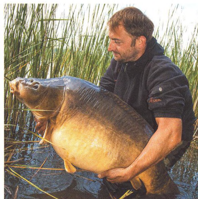
14 Ach tak! / aneb otestujte si kapří teze