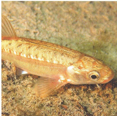
30 Ledové Altausseer See