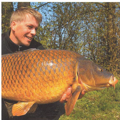
04 Vzhůru na jarní kapry