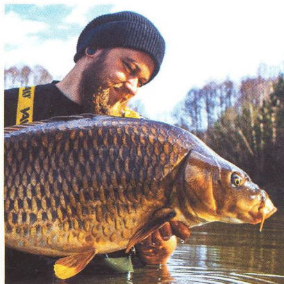
20 Vražedně atraktivní mělčiny