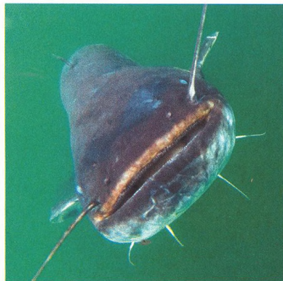
30 Kde se sumci neloví / pod vodou lomu Rumchalpa