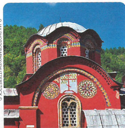
PEĆ (PEJA; STR. 225), KOSOVO