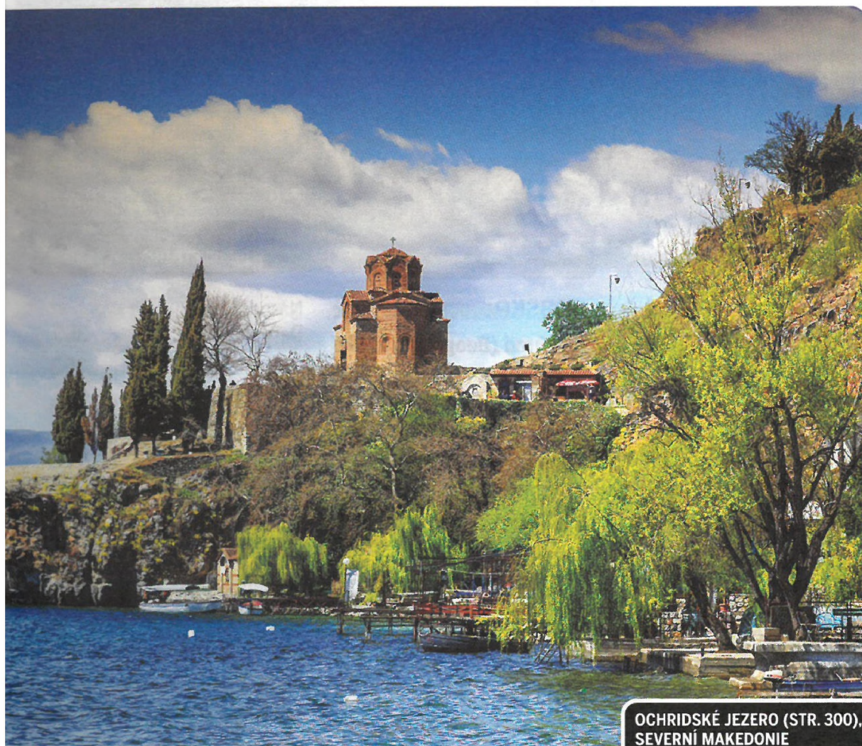
OCHRIDSKÉ JEZERO (STR. 300), SEVERNÍ MAKEDONIE