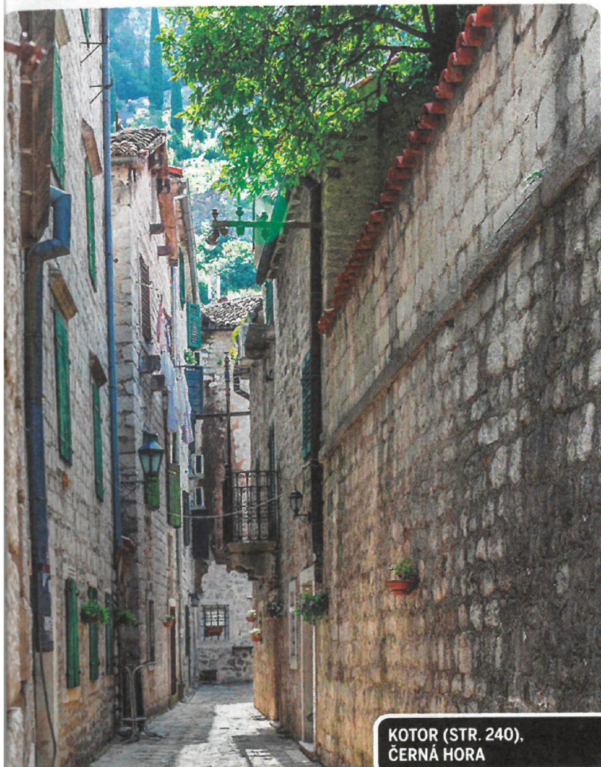
KOTOR (STR. 240), ČERNÁ HORA