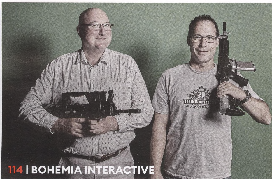
114 | BOHEMIA INTERACTIVE