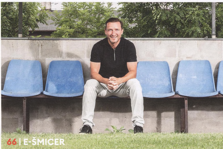
66 | E-ŠMICER