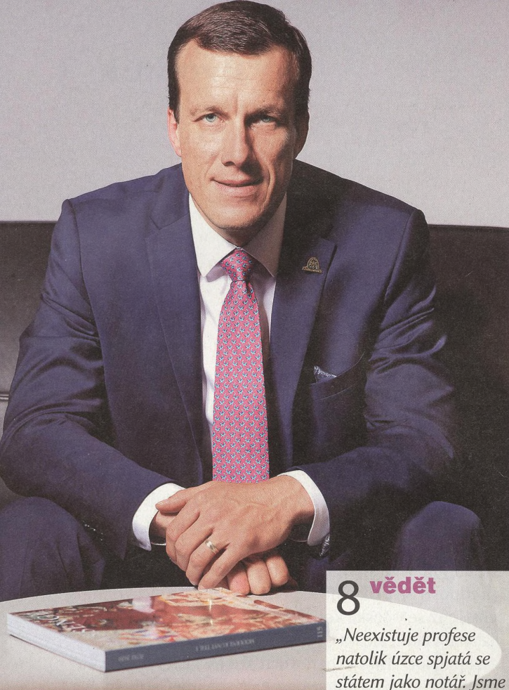
RADIM NEUBAUER prezident Notářské komory ČR