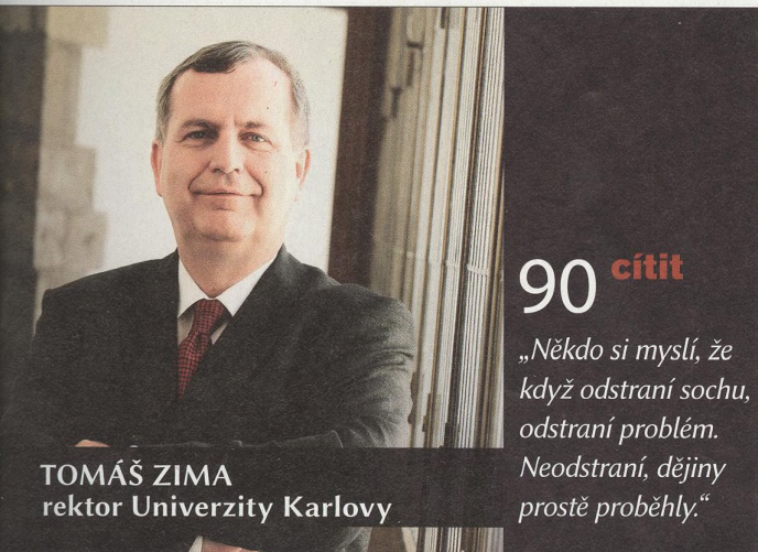
TOMÁŠ ZIMA rektor Univerzity Karlovy

„Pro lidi v nepohodě nebo s duševními problémy je alkohol zvláště nebezpečný. Někomu je smutno, opije se a v kocovině se jeho deprese ještě o hodně prohloubí.“