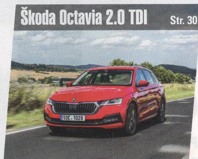
Škoda Octavia 2.0 TDI