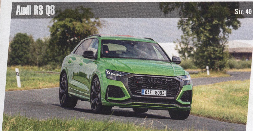
Audi RS Q8