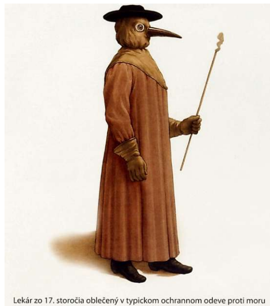
Lekár zo 17. storočia oblečený v typickom ochrannom odevu proti moru