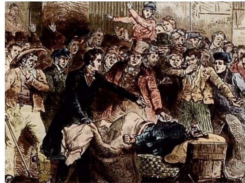
Zobrazenie epidémie cholery v Paríži v roku 1832