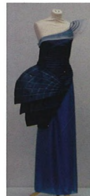
Společenské šaty inspirované operou v Sydney od B. Brůžkové