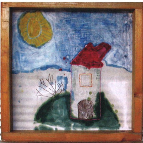
Výstava: Téměř vše co umíme, jsme se naučily od svých žáků.

↑↑ Tkaná tapiserie a její autorka Z. Nyčová.