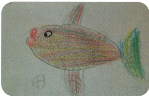
Ryba - dětská práce; experimentální výuka