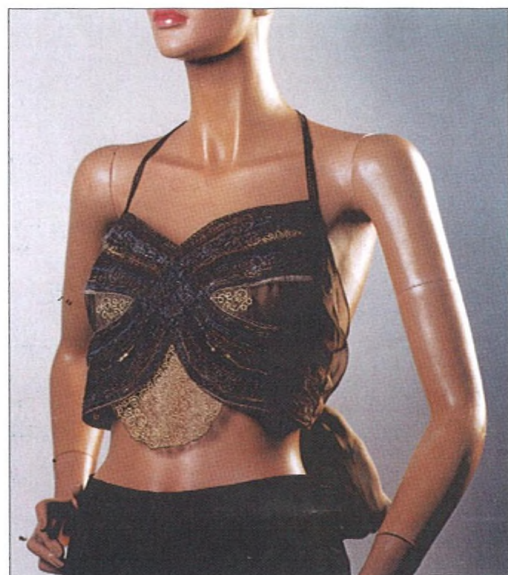
Krajka ze školy v Itálii