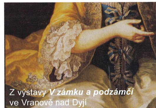
Z výstavy V zámku a podzámčí ve Vranově nad Dyjí