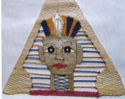
Práce „Tutanchamon“ ze soutěže Děti a krajka